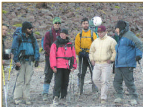
Miembros de la Expedición: Licancabur 2003, junto al Director Ejecutivo Nacional de SERGEOMIN.

El año 2004, la NASA, conjuntamente SERGEOMIN y el Servicio Nacional de Áreas Protegidas SERNAP de Bolivia, realizarán comparaciones entre las muestras depositadas en ambas placas, para descubrir si, en ese espacio de tiempo entre la Segunda Expedición (noviembre 2003) y la Tercera Expedición (octubre 2004), se crearán nuevas especies o, si los actuales microorganismos asumirán nuevas estrategias para sobrevivir a las condiciones ambientales y la radiación ultravioleta. De esa forma, el año 2004, se podrá establecer, cómo sobrevivieron