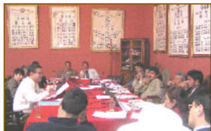
Informe presentado en el Salón de los Retratos del Honorable Senado Nacional.

De esta forma, el Proyecto Exploración en Concesiones Mineras de COMIBOL, así como el Proyecto de Clasificación de Cuerpos de Agua en las Cuencas Altas de los Ríos Tupiza y Cotagaita, la elaboración de los Mapas: Geológico, de Depósitos Metálicos, de Infraestructura, e Hidrogeológico, conjuntamente el Proyecto NASA-SERGEOMIN- Licancabur 2003, entre otros, fueron ampliamente explicados a los representantes nacionales. Por otro lado, a invitación expresa de la Comisión de Desarrollo Sostenible de la Cámara de Diputados y la Brigada Parlamentaria Potosina, la Dirección Ejecutiva Nacional hizo la presentación relativa a la "Potencialidad de los Recursos Hídricos del Occidente de Bolivia".