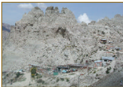
Carcavas de la Erosión de Aguas Superficiales.

Debido al crecimiento de la población en la ciudad de La Paz, en los últimos diez años, los desastres naturales han provocado el aumento de víctimas. Aun cuando la población se encuentra más expuesta, la gente percibe las amenazas naturales, de diferente manera, dando como resultado, cierta influencia en su capacidad de respuesta a los peligros. Con el objeto de resaltar la importancia de la geomorfología en el estudio de los riesgos naturales, a continuación se indican sus principales características y contribuciones, en la búsqueda de una educación para la prevención de desastres. Para conocimiento de la población, los elementos geomorfológicos más importantes son los riesgos y las amenazas. El aspecto más relevante es aquel referido a las amenazas, las cuales se definen como la presencia de cualquier relieve inestable que no se encuentra en equilibrio con su